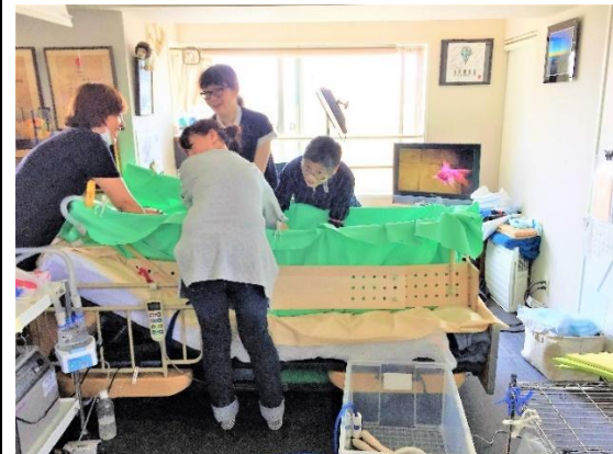
給湯、身体洗い、排水

● NHK e テレ バリバラ放送 にて、入浴放映されました(R5年3月17日)