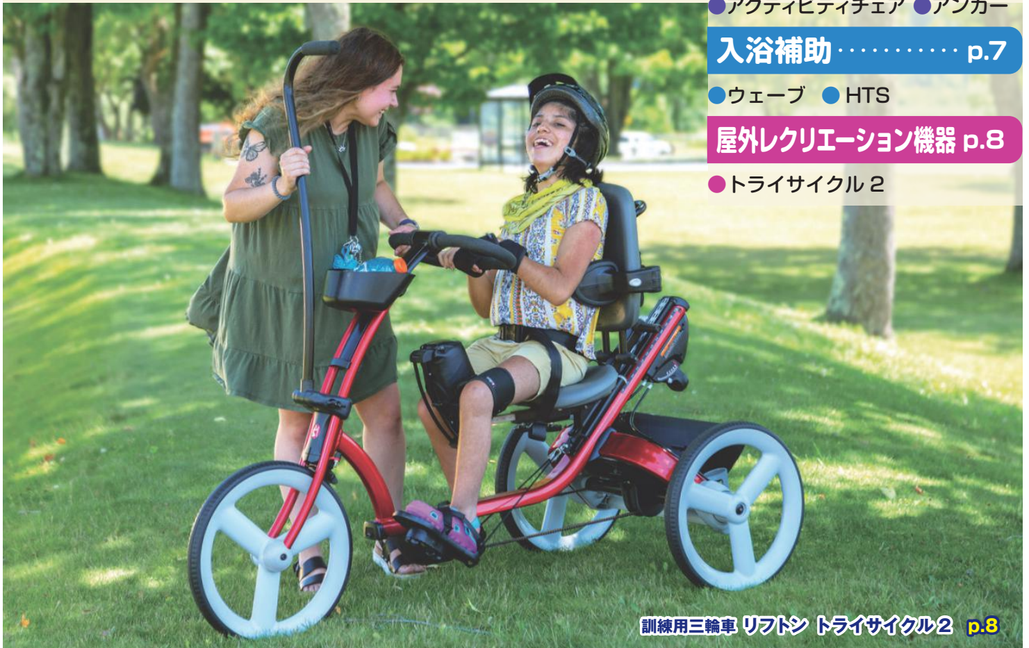
訓練用三輪車 リフトン トライサイクル 2 p.8