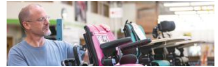
調節式歩行訓練車 リフトン ペーサー p.2