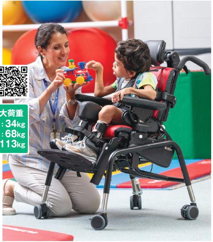
▲スタンダードタイプの一例。