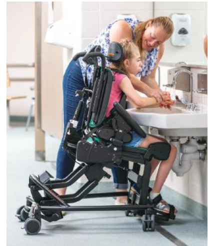
▲ハイロータイプの一例。

◀スタンダードタイプ 本体のみの一例。 写真の組み合わせは、スタンダード背もたれ、ティルトスプリングベース+ショート脚、アームレスト標準タイプ、シート M サイズ。