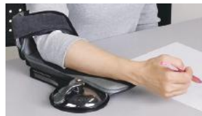
▲エルボーアンカー