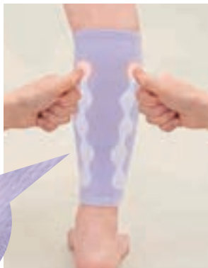
10個のゲルの突起がふくらはぎを刺激

超柔軟ゲル素材「クリスタルゲル®」 を加工したものを配置。ふくらはぎ を引き締めながらゲルが筋肉を刺 激してやさしくマッサージ。 寝ながらマッサージで 翌朝すっきり!