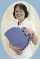
岐阜大学医学部 看護学科 社本准教授 博士(看護学)

従来の洗髪方法では、準備や片付けの負担が大きく、清潔にしてあげたいと思いつつも実際には難しいと感じる介護者や、本当は毎日きれいにしたいと思いつつもお願いができず我慢をしている患者さんの声がありました。また適切な洗髪が行われず頭皮や頭髮に汚れや細菌が残り、医療関連感染症等を引き起こすリスクも高まります。患者さんが「すっきりおだやかな気持ち」になれると同時に、介護者の負担も軽減できるように、ぜひ CARE GEAR を活用して、毎日のケアをもっと簡単に、もっと安心して行っていただければと思います。