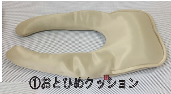
①おとひめクッション

※このアプローチの有効性には個人差があり、また背臥位では唾液や嘔吐物の誤嚥リスクもあります。個々の状態に注意し、安全を確保しながらお試しください。