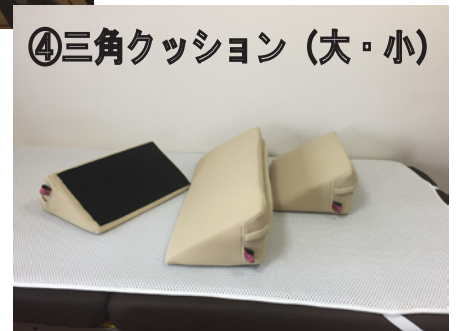
④三角クッション (大・小)