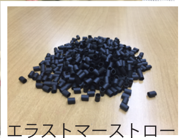
エラストマーストロービーズ