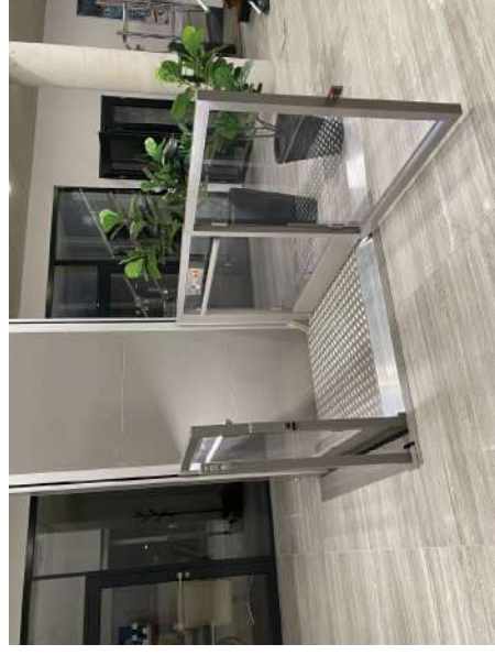
自動開閉ドア(オプション)